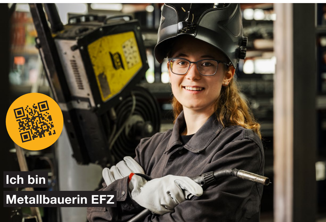
Ich bin Metallbauerin EFZ

Nach deinem Abschluss als Metallbauer/in EFZ kannst du mit einer verkürzten Lehrzeit von zwei Jahren zusätzlich die Ausbildung als Metallbaukonstrukteur/in EFZ machen.