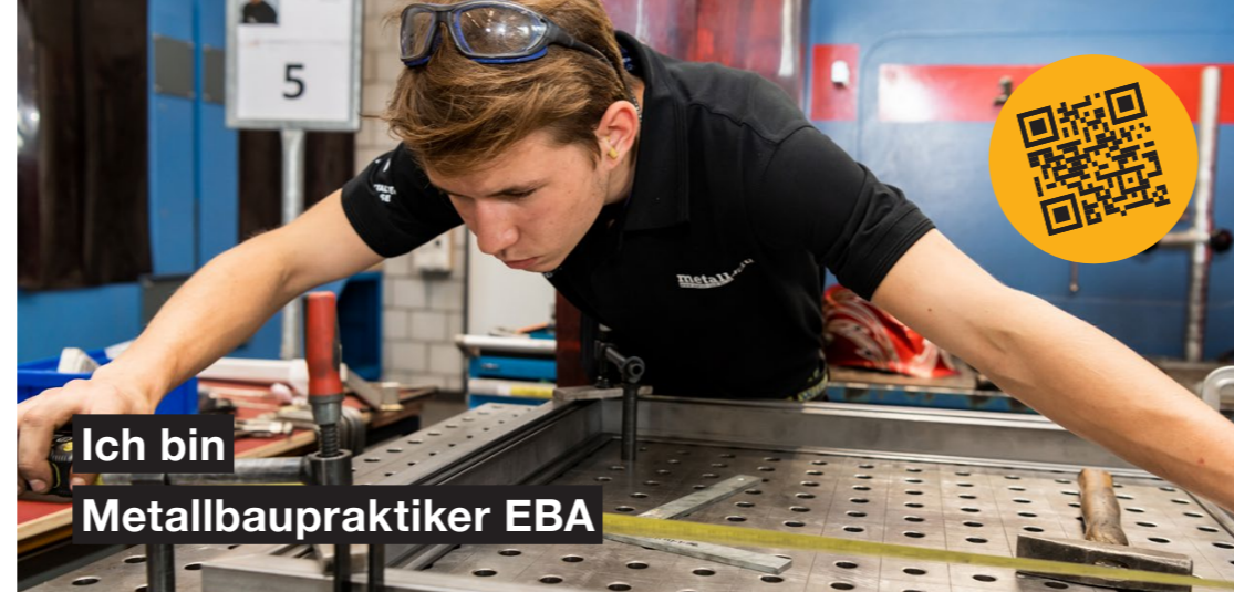
Ich bin Metallbaupraktiker EBA

Deine Arbeit erledigst du sowohl in der Werkstatt als auch auf der Baustelle. In der Werkstatt begleitest du den gesamten Herstellungsprozess. Du studierst Baupläne, bereitest die Materialien vor und fertigst die Objekte an. Anschliessend transportierst du die fertigen Produkte auf die Baustelle und montierst sie anhand der Pläne. Teamarbeit ist ein wichtiger Bestandteil deines Arbeitsalltages.