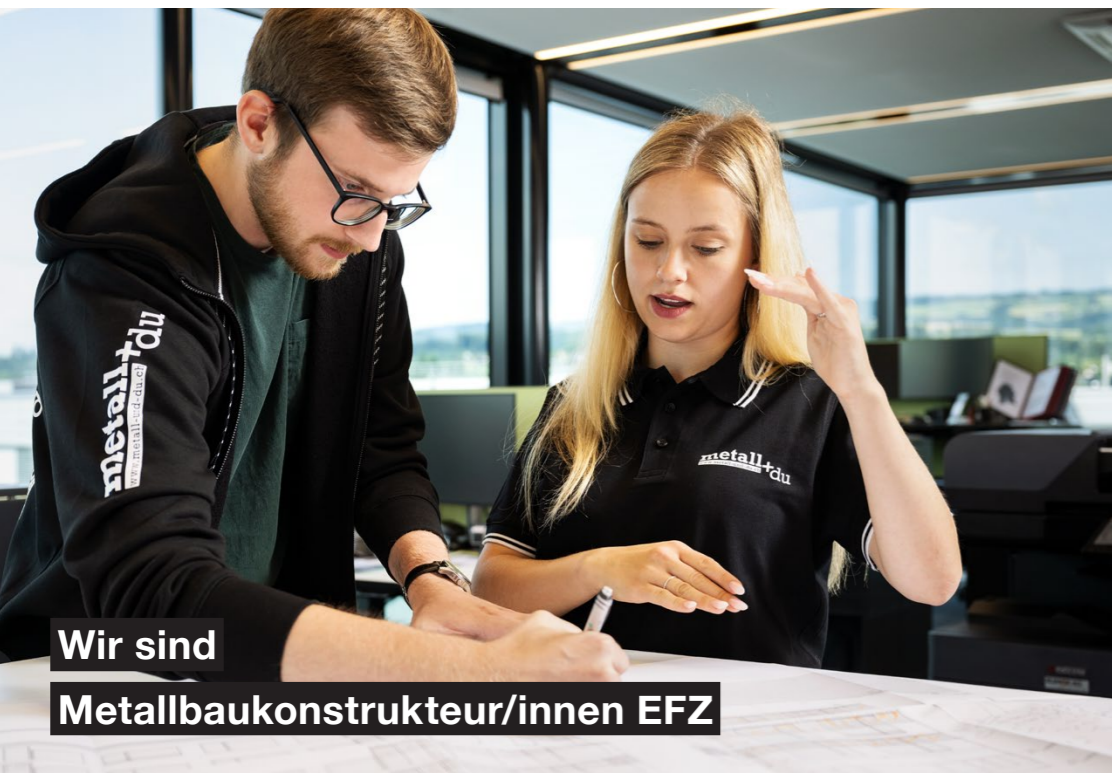
Wir sind Metallbaukonstrukteur/innen EFZ

Deine Arbeit ist vielfältig und du arbeitest nicht nur im Büro an deinem Computer, sondern besprichst deine Projekte auch mit dem Team der Werkstatt oder bist draussen auf der Baustelle für die Massaufnahme und Treffen mit Kund/innen, Architekt/innen und Ingenieur/innen. Du betreust den gesamten Planungsprozess und begleitest deine Projekte von A bis Z.