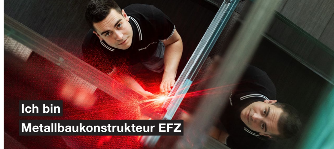
Ich bin Metallbaukonstrukteur EFZ