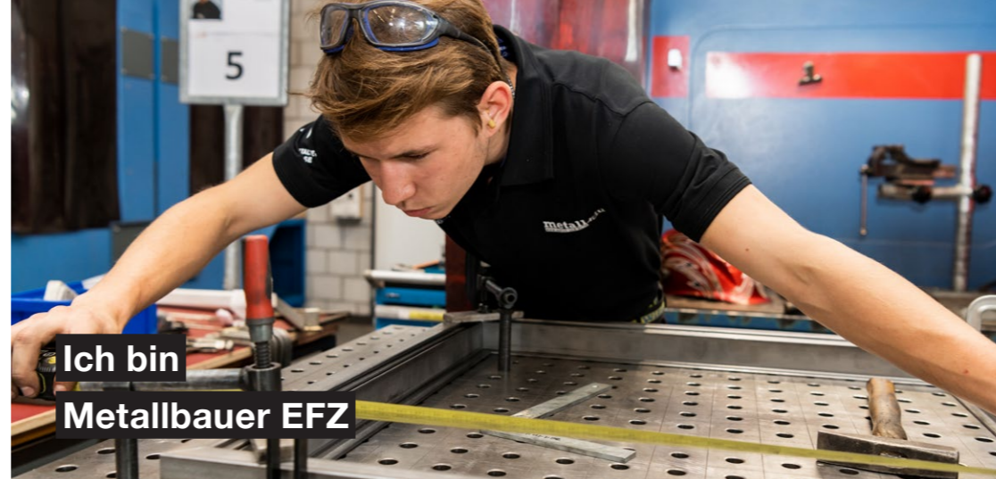
Ich bin Metallbauer EFZ

Deine Arbeit erledigst du sowohl in der Werkstatt als auch auf der Baustelle. In der Werkstatt begleitest du den gesamten Herstellungsprozess. Du studierst Baupläne, bereitest die Materialien vor und fertigst die Objekte an. Anschliessend transportierst du die fertigen Produkte auf die Baustelle und montierst sie anhand der Pläne. Teamarbeit ist ein wichtiger Bestandteil deines Arbeitsalltages. Interessiert? Hier erfährst du alle nützlichen Informationen über den Beruf.